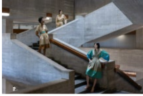
Modelfotografie aufgenommen 2022 anlässlich des 100-jährigen Jubiläums des Schweizer Haute-Couture-Labels Akris im Treppenhaus der Universität St.Gallen, einem Brutalismus-Bau des Schweizer Architekten Walter M. Förderer.