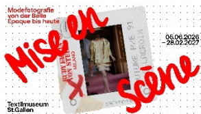
Key Visual „Mise en Scène. Modelfotografie von der Belle Époque bis heute“ mit einer Laufstegfotografie von Rudy Faccin von Steidl, 1991