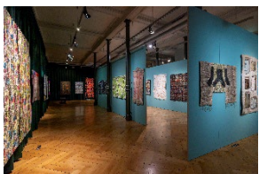
Ausstellungsansicht „9. Europäische Quilt-Triennale“ / Exhibition View “9th European Quilt Triennial”

Textilmuseum St.Gallen