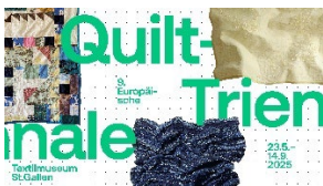
9. Europäische Quilt-Triennale / 9th European Quilt Triennial Key Visual