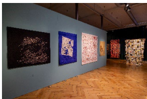
Ausstellungsansicht „9. Europäische Quilt-Triennale“ / Exhibition View “9th European Quilt Triennial”

Textilmuseum St.Gallen © Charlotte Leonie Hammann