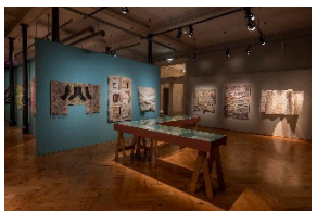
Ausstellungsansicht „9. Europäische Quilt-Triennale“ / Exhibition View “9th European Quilt Triennial”

Textilmuseum St.Gallen