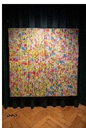
Preis für Innovation im grossen Format: „Fragments des Alltags“ von Judith Mundwiler, CH / Prize for Innovation in a large Format: “Fragments of Everyday Life” by Judith Mundwiler, CH

Textilmuseum St.Gallen © Charlotte Leonie Hammann