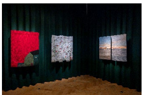
Ausstellungsansicht „9. Europäische Quilt-Triennale“ / Exhibition View “9th European Quilt Triennial”

Textilmuseum St.Gallen