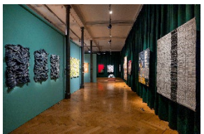
Ausstellungsansicht „9. Europäische Quilt-Triennale“ / Exhibition View “9th European Quilt Triennial”

Textilmuseum St.Gallen