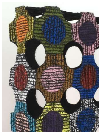
Heidi König, Schweiz KUNTERBUNT! MULTI-COLOURED!

Schwarzer Baumwollstoff, schwarzes Baumwoll- und Polyestervlies, Polyesterfäden, Öl-Pastellkreide/ frei maschinengenähter Wholecloth, gewaschen und getrocknet für mehr Strukturen, bemalt mit Acrylmedium und Ölkreide, in Formen geschnitten