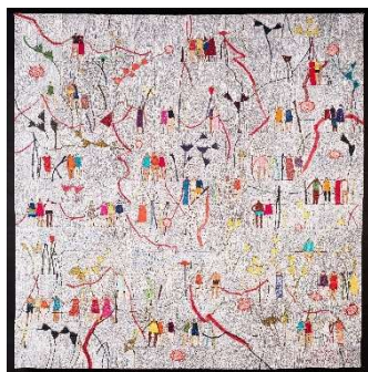
Rita Merten, Schweiz KÖRPERLICHE DISTANZ PHYSICAL DISTANCING

Baumwolle, diverse Fäden/ Monoprint auf Baumwolle, maschinengenäht, gequiltet, maschinen-freihandgestickt