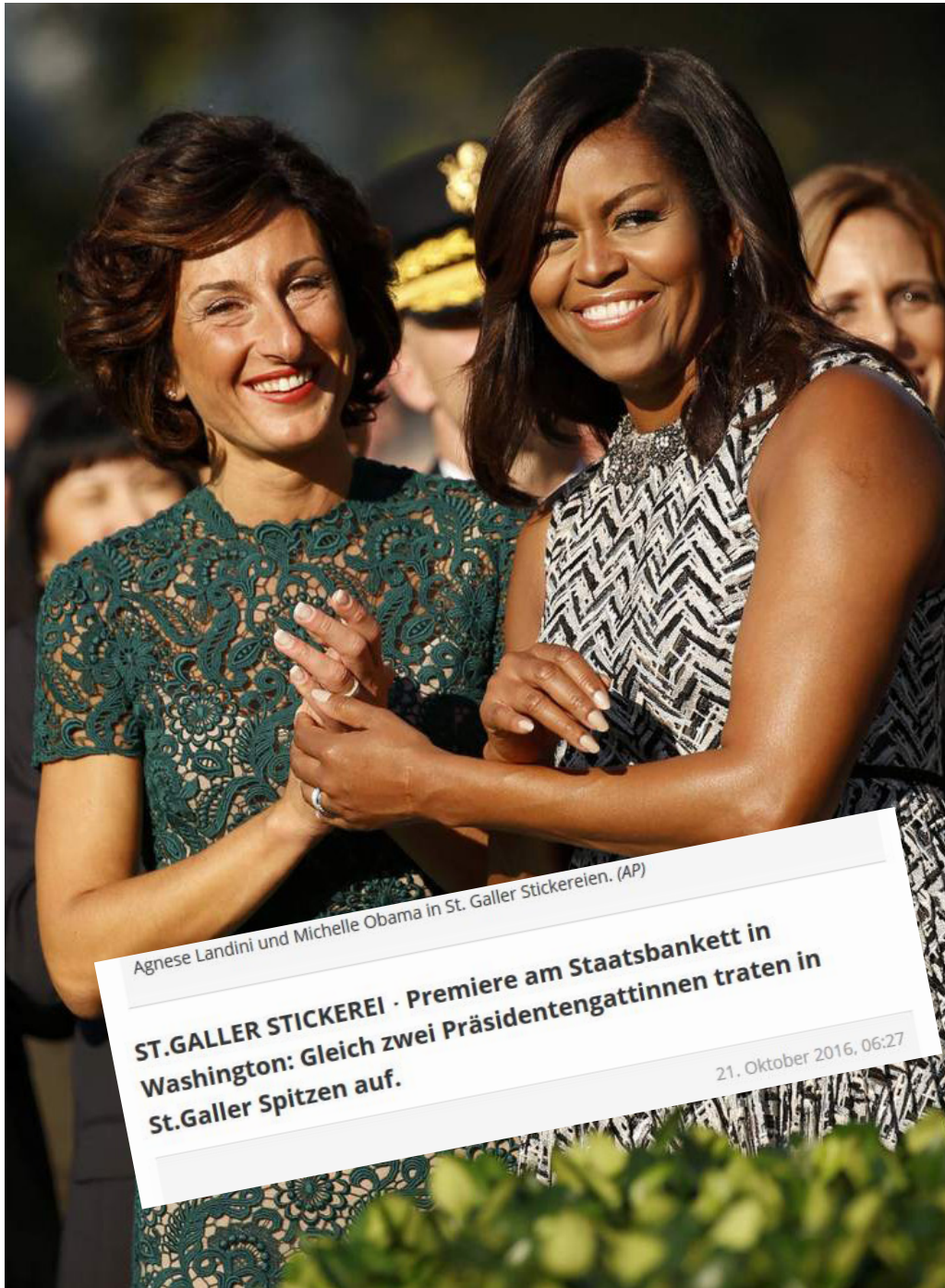
Agnese Landini und Michelle Obama in St. Galler Stickereien.

ST.GALLER STICKEREI · Premiere am Staatsbankett in Washington: Gleich zwei Präsidentengattinnen traten in St.Galler Spitzen auf.