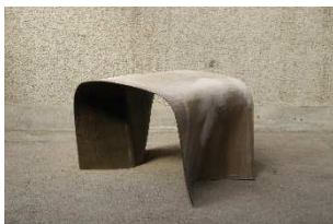
Prototyp eines Ausstellungsmöbels aus Concrete Canvas. Designer: Zeller & Moyer, 2017 hergestellt von Heinz Baumann. © Zeller Moyer