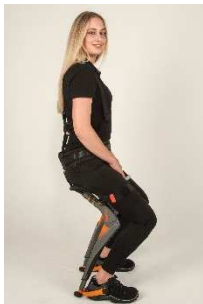
Chairless Chair © noonee AG