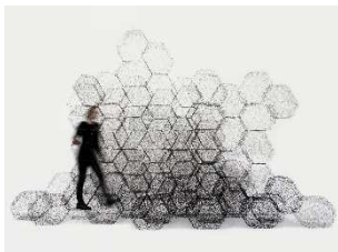
Stone Web Idalene Rapp und Natascha Unger, Modulare Wand, 2017. Die Module wurden mit Wickeltechnik geformt und mit Bioharz versteift. © weißensee kunsthochschule berlin