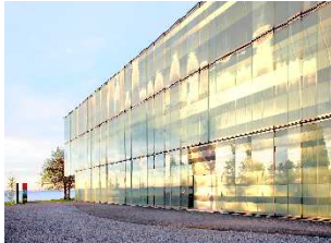
Würth Haus Rorschach