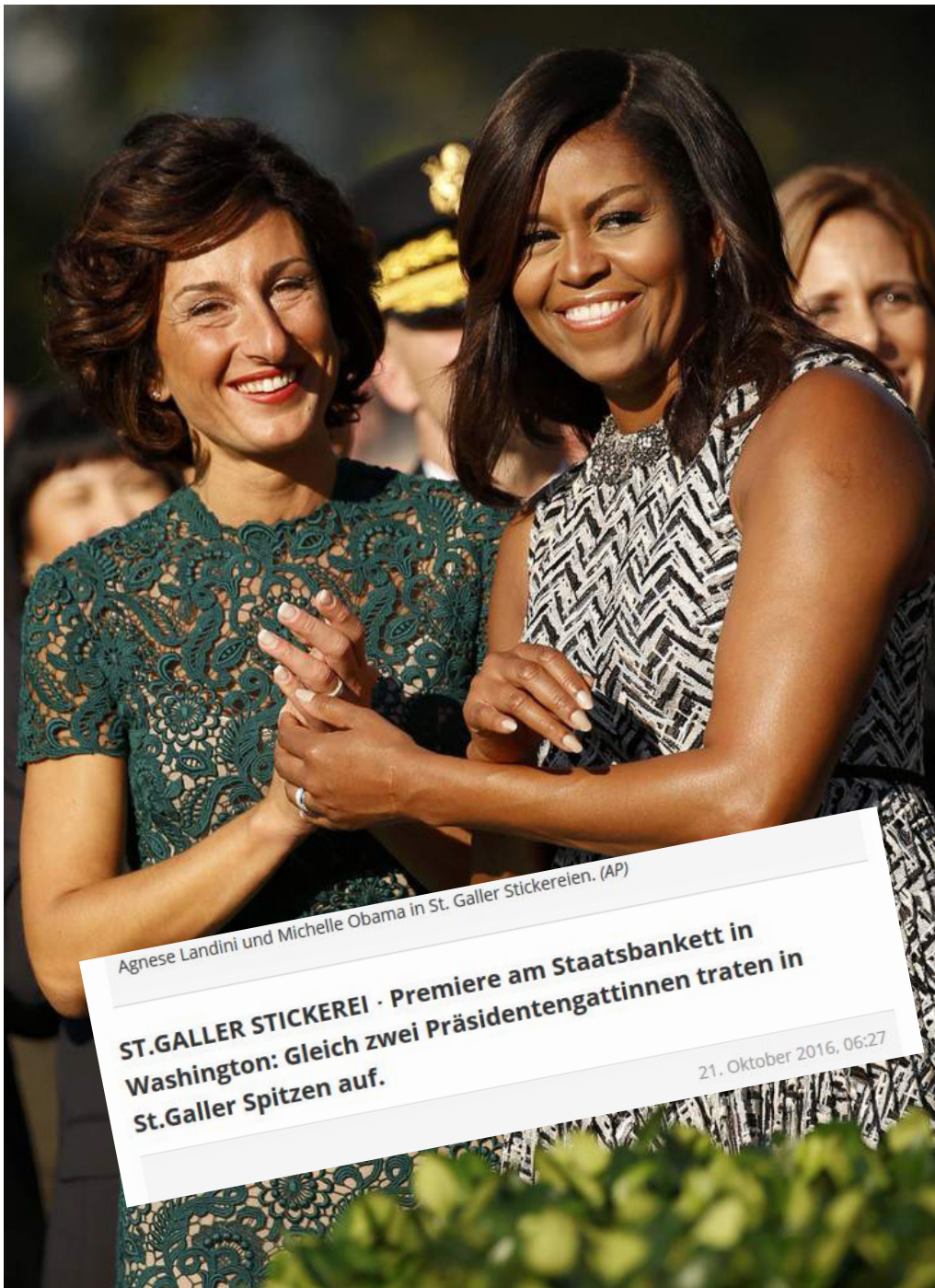
Agnese Landini und Michelle Obama in St. Galler Stickereien.

ST.GALLER STICKEREI · Premiere am Staatsbankett in Washington: Gleich zwei Präsidentengattinnen traten in St.Galler Spitzen auf.