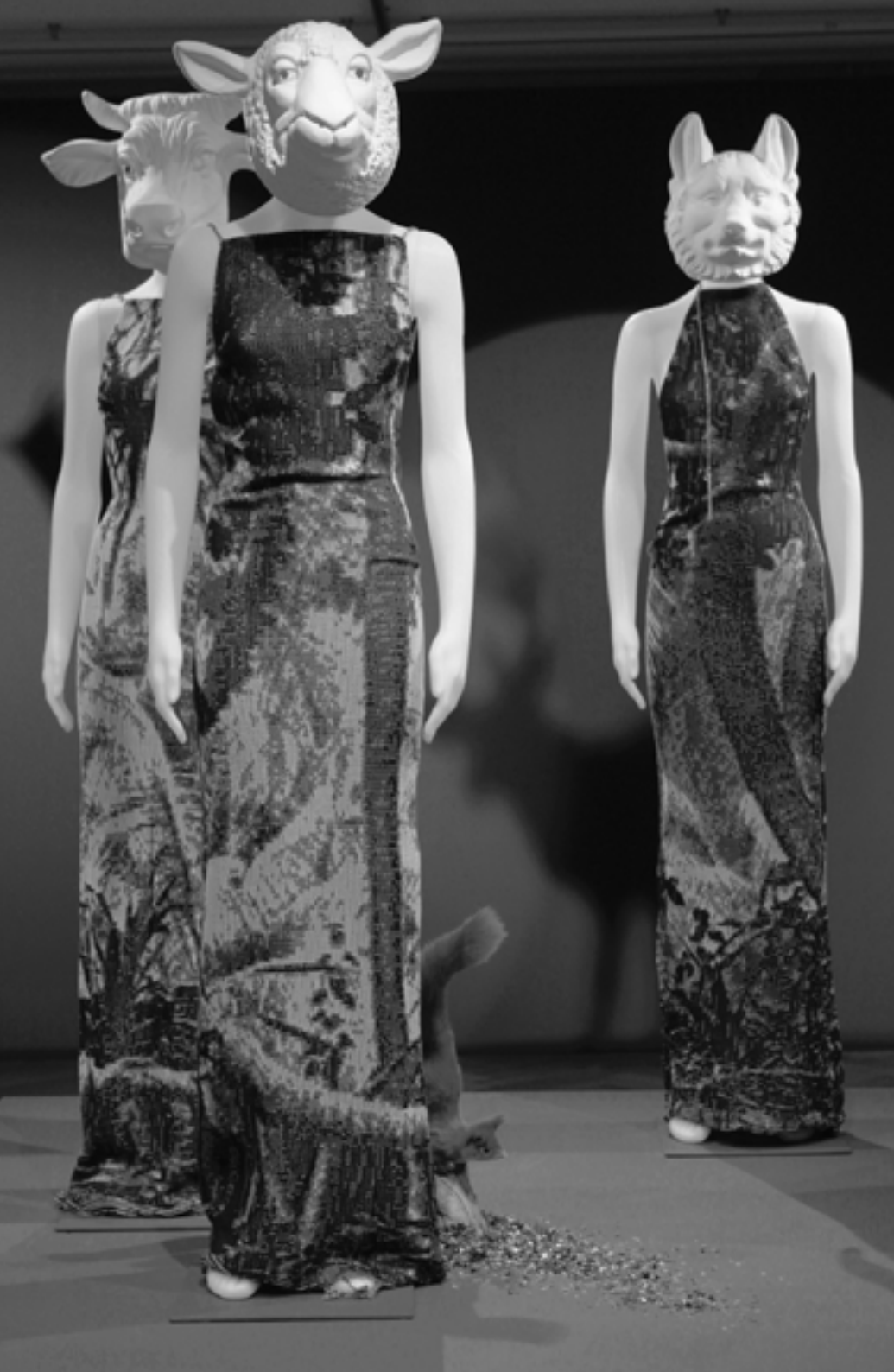
Ausstellungsansicht aus der Ausstellung «Viecher».

Der Satz von Karl Valentin: «Kunst ist schön, macht aber viel Arbeit» bewahrheitete sich für das Textilmuseum St. Gallen 2013 – mit sechs Ausstellungen liegt ein erfolgreiches aber arbeitsintensives Jahr hinter uns.