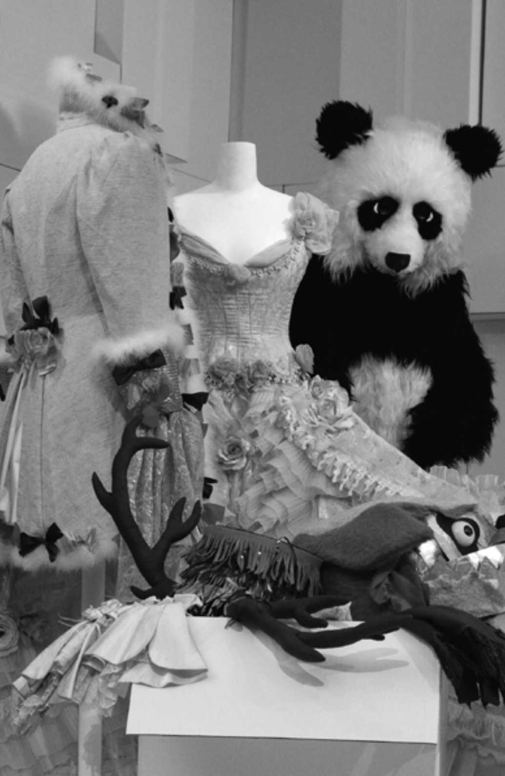
Objekte aus dem Bestand des Fundus des Theaters St.Gallen, zu sehen in der Ausstellung «Sammlungsweiten».