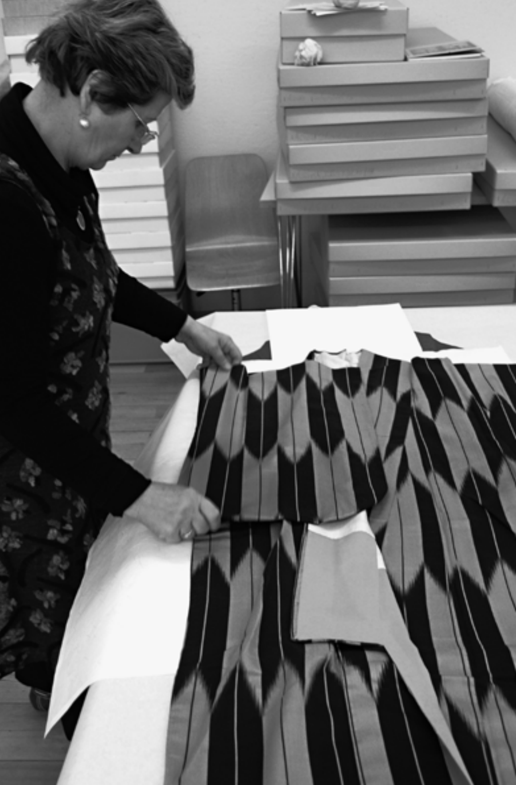
Die Restauratorin begutachtet einen Kimono aus dem Nachlass von Toshie Nanjo.